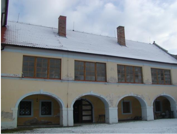
Obr. 12 Pohled na nově zrekonstruovaná okna zámku Růžkovy Lhotice.

Největší stavební akcí Muzea Podblanicka v roce 2009 byla rekonstrukce oken v objektu zámku Růžkovy Lhotice. V chodbě zámku v prvním patře byla nahrazena stávající čtyři velká okna, která již byla v dezolátním stavu novými. Jednalo se o repliky původních oken. Akce mohla být provedena díky dotaci Středočeského kraje.