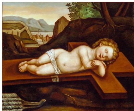
Obr. 3 Zrestaurovaný obraz „Ležící jezulátko“.

V roce 2009 bylo přistoupeno k restaurování nástropních maleb v kapli vlašimského zámku, která je atraktivní součástí expozičních prostor muzea. Toto restaurování provedlo město Vlašim, jako majitel zámku, za finanční podpory Národního památkového ústavu. Muzeum Podblanicka se podílelo na přípravě celé akce a následně zajišťovalo technickou stránku realizace restaurátorských prací.