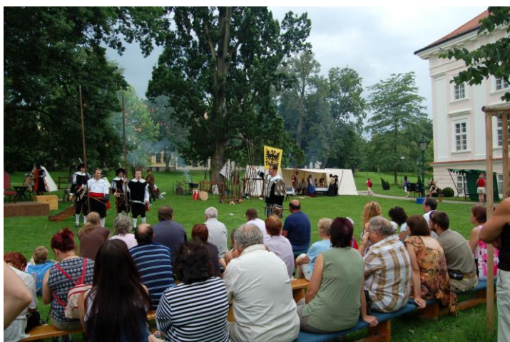
Obr. 7, 8 Záběry z průběhu Vostroveckého slavení ve vlašském zámeckém parku.

Jako každoročně se Muzeum Podblanicka zapojilo také do pořádání nejrůznějších akcí nadregionálního a mezinárodního charakteru, jako jsou Mezinárodní den památek, Festival muzejních nocí, Dny evropského kulturního dědictví či Den Středočeského kraje. V rámci těchto akcí připravilo pro své návštěvníky celou řadu doprovodných akcí.