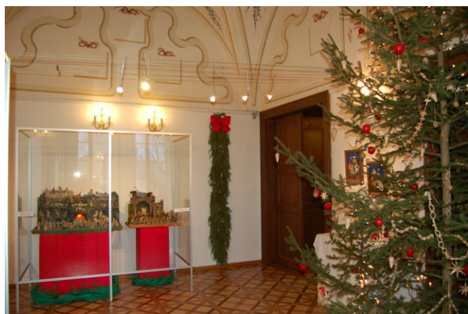
Obr. 5 Ukázka instalace vánoční výstavy ve vlašimském zámku Tichá noc.

Příjemným doplněním muzejní nabídky se staly dvě zapůjčené výstavy, které sice byly svým rozsahem komorní, ale přibližovali návštěvníkům atraktivní témata. Jednalo se jednak o výstavu věnovanou osobnosti cestovatele, spisovatele a vynikajícího arabisty Aloise Musila, a jednak představení architektonického projektu, který má být realizován nedaleko zámku Konopiště podle návrhu architekta Jana Kaplického.