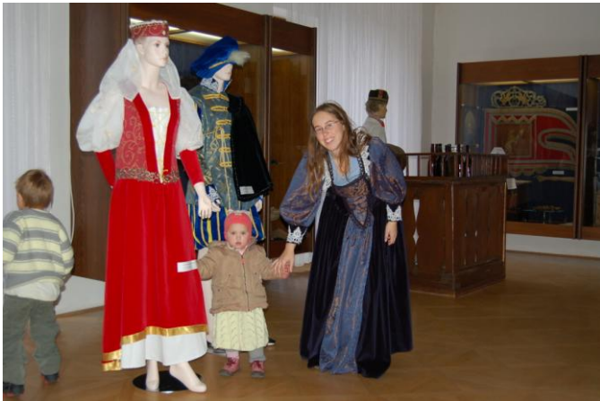
Obr. 9 Během Dne Středočeského kraje se návštěvníci muzea mohli zapojit do akce „Sluší Vám historie?“, v jejímž rámci si mohli zkusit v muzejních expozici historické kostýmy.

Dobrou spolupráci má muzeum se školami v regionu. Kromě běžné nabídky prohlídek expozic a výstav a odborných exkurzí pro školní mládež se konaly i dvě akce se širším zaměřením. V roce 2009 proběhl již třetí ročník výtvarné soutěže pro děti, žáky a studenty z mateřských, základních a středních škol v regionu, tentokrát s pod názvem „ Malujeme s muzeem “. Tuto soutěž organizovalo Muzeum Podblanicka ve spolupráci se Středočeským krajem a městy Benešov, Vlašim a Votice a byla součástí projektu Historický rok na vlašimském zámku. Do soutěže bylo přihlášeno 234 prací dětských výtvarníků ze 14 škol na téma Středověk na Podblanicku a 17. prosince 2009 byly v obřadní síni vlašimského zámku v rámci slavnostního odpoledne předány věcné ceny autorům vítězných prací. Všechny práce zaslané do soutěže pak byly vystaveny ve vlašimském zámku na přelomu ledna a února 2010. Dále v listopadu 2009 pomáhalo muzeum technicky zajistit SOŠ a SOU Vlašim soutěž O pohár blanických rytířů (viz Příloha č. 5).