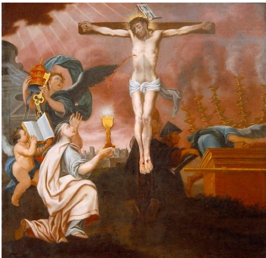
Obr. 2 Zrestaurovaný obraz „Ukřižování Krista“.