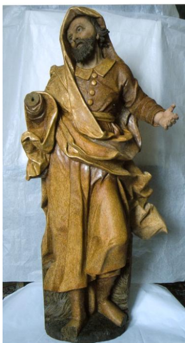
Obr. 1 Zrestaurovaná polychromovaná plastika světce.

I v roce 2009 bylo nedílnou součástí péče o sbírkový fond muzea restaurování a konzervování předmětů, u kterých si to vyžadoval jejich stav. Byla zrestaurována barokní dřevěná polychromovaná plastika světce (inv. 2715). Na financování restaurování této plastiky bylo využito státní dotace ISPROFIN Ministerstva kultury ČR.