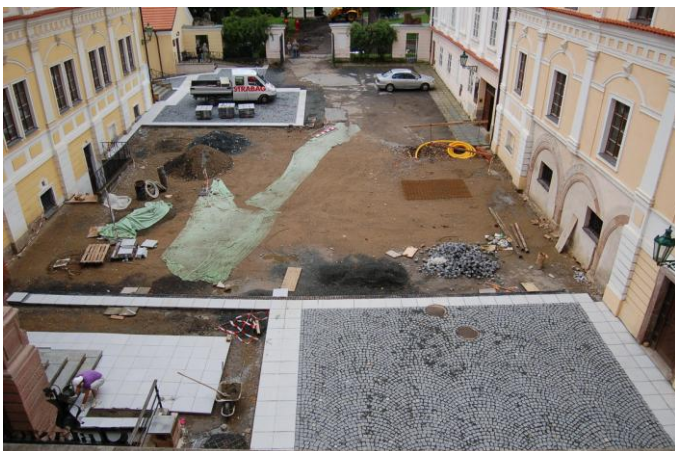
Obr. 11 Průběh rekonstrukce nádvoří vlašimského zámku v červenci 2009.

V roce 2009 zahájilo město Vlašim komplexní rekonstrukci náměstí. V rámci této rekonstrukce byla provedena i úprava nádvoří vlašimského zámku a přístupových komunikací. Ačkoli byla rekonstrukce průběžně konzultována jak s investorem, tak s dodavatelem stavby, aby byl v co největší míře minimalizován její dopad na chod muzea, přesto výrazně zasáhla tato rekonstrukce do návštěvnického provozu muzea v období od května do listopadu 2009.