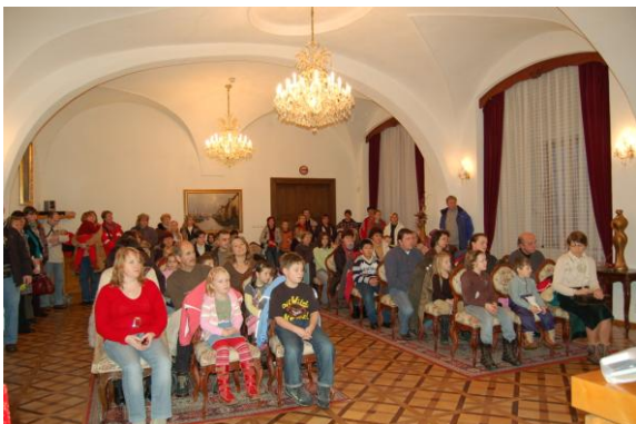
Obr. 10 Slavnostní vyhlášení výsledků výtvarné soutěže Malujeme s Muzeem 17.12. 2009.

I v roce 2009 byla poskytována metodická pomoc obecním kronikářům v regionu působnosti muzea.