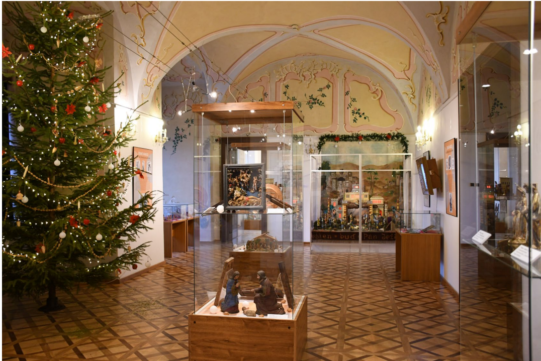
Obr. 9 Instalace výstavy České Vánoce v zámku ve Vlašimi