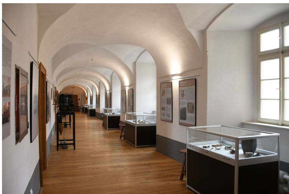
Obr. 11 Výstava Archeologické poklady v klášteře sv. Františka ve Voticích