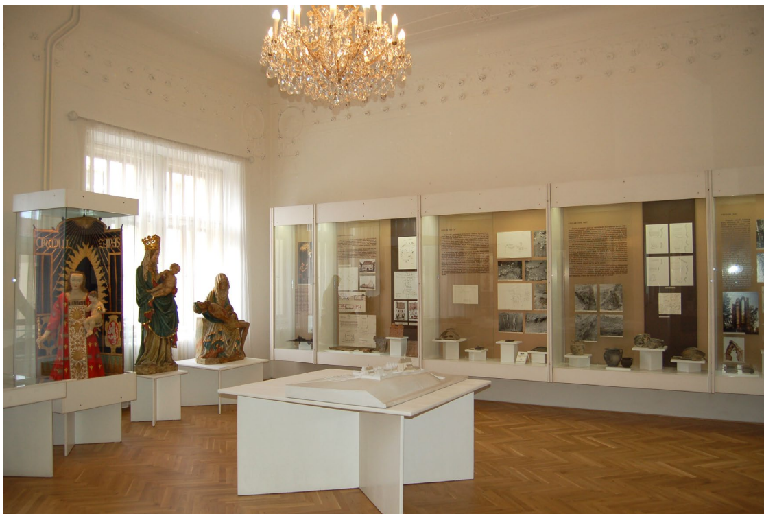
Obr. 7 Expozice Muzea Podblanicka Historie města Benešov bude díky dobré spolupráci s Muzeem umění a designu v Benešově zájemcům o historii města zpřístupněna v domě čp. 74 na Malém náměstí až do roku 2025

zájemcům o historii města zpřístupněna až do roku 2025. Současně muzeum zahájilo ve spolupráci se Středočeským krajem a městem Benešov přípravu projektu vytvoření nové pobočky Muzea Podblanicka v Benešově, a to v prostorách bývalé Piaristické koleje.