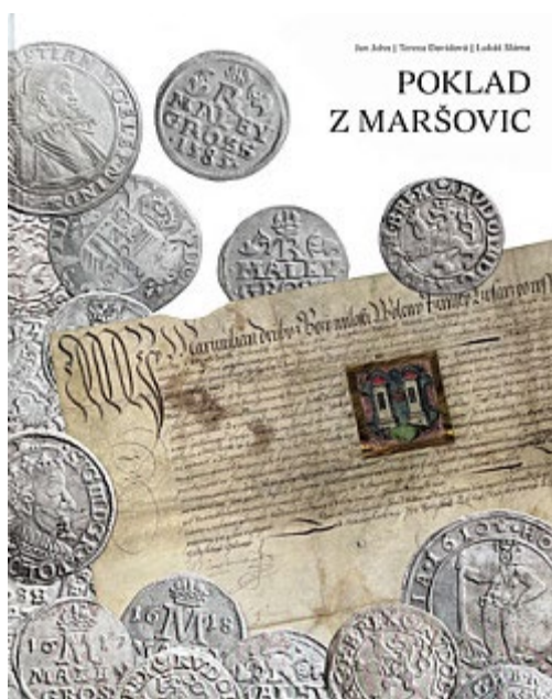
Obr. 20 Monografické publikace, na jejichž vydání se Muzeum Podblanicka v roce 2023 podílelo