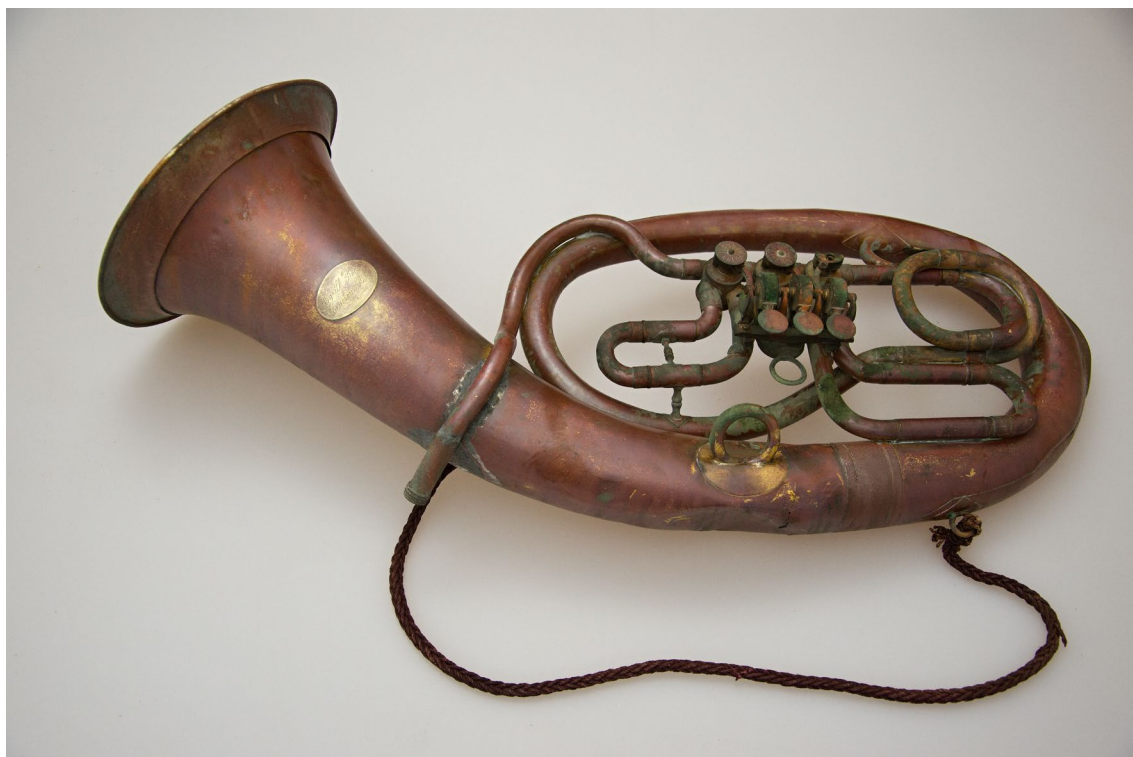
Obr. 1 Mezi přírůstky, které v roce 2023 obohatily sbírky muzea, byla trubka z 20. let 20. stol. opatřená štítkem prodejce Cyrila Kočího z Benešova

Rozšíření sbírkového fondu muzea proběhlo v roce 2023 především prostřednictvím zápisu nálezů získaných v rámci záchranné archeologické činnosti, část pak prostřednictvím vlastní činnosti muzea, nákupem a darem do muzejních sbírek. Z celkového počtu nově získaných přírůstků připadlo 5 položek na dar věnovaný muzeu jedním dárce, 138 položek činil bezplatný převod z majetku města Pyšely a 1 předmět byl získán koupí.