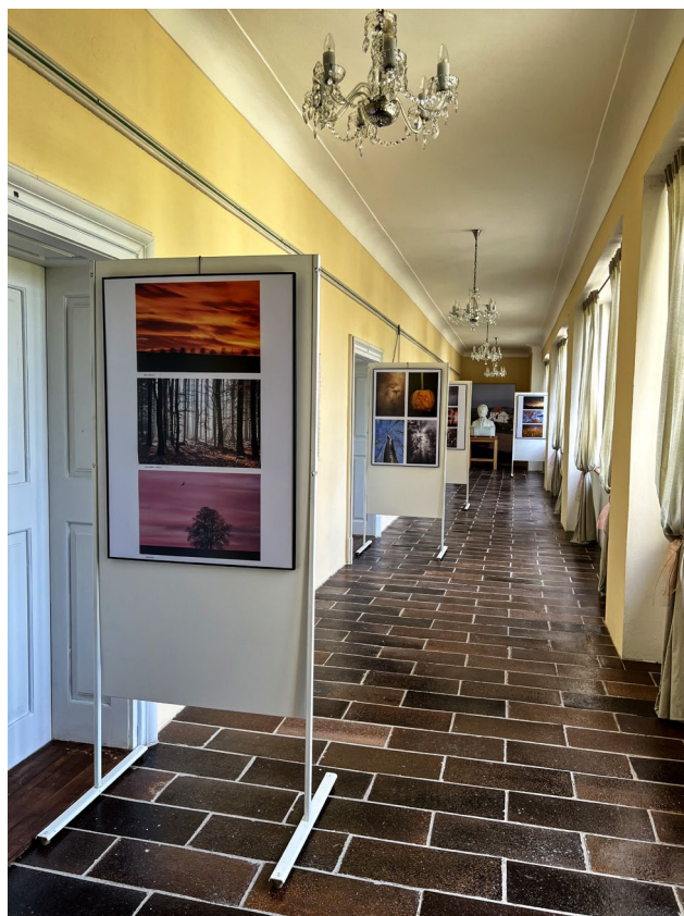
Obr. 10 Výstava fotografií Lenky Komínkové v zámku Růžkovy Lhotice