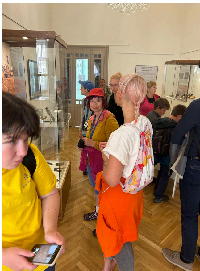
Obr. 16 Návštěva klientů Denního stacionáře Ruka pro život v pobočce muzea v Benešově