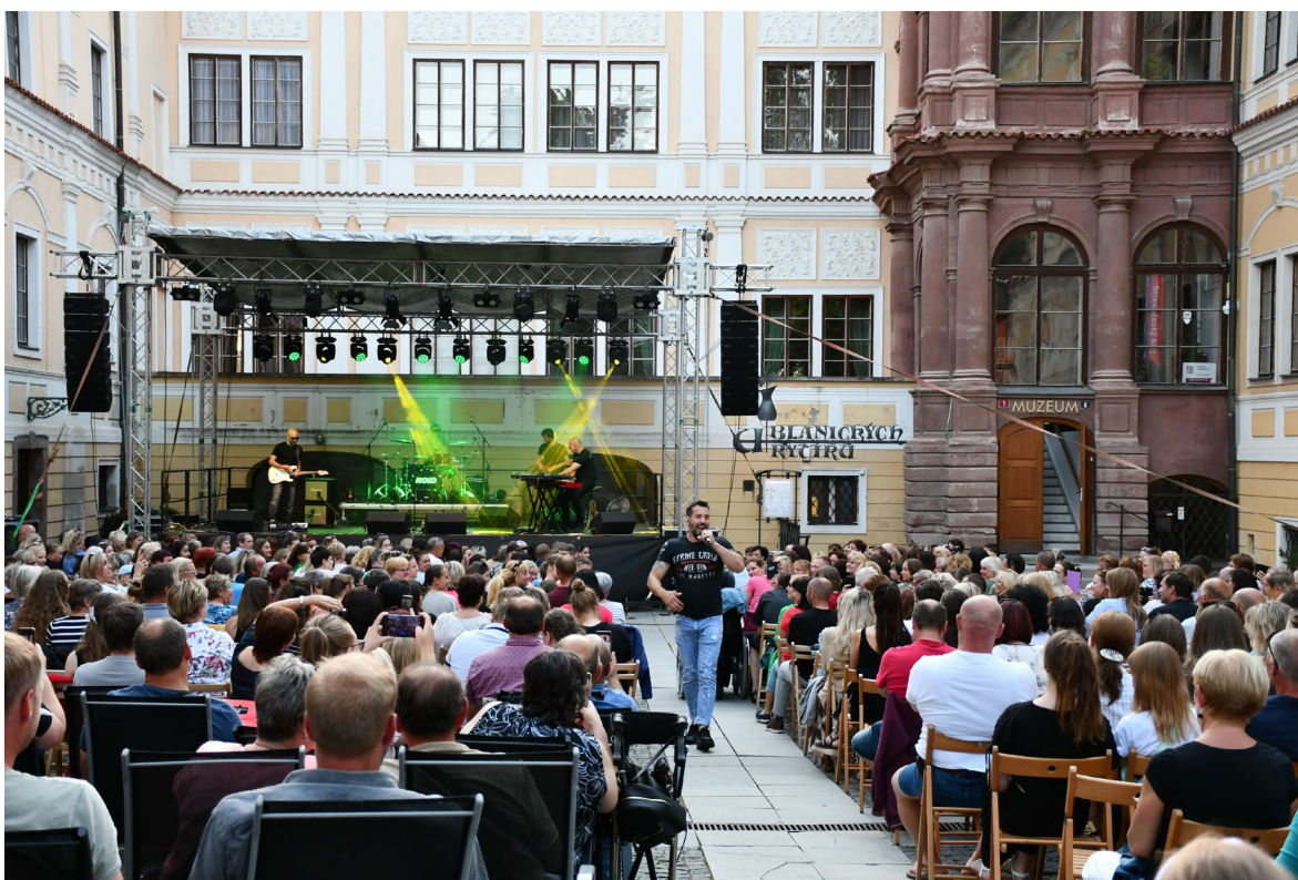
Obr. 12 Koncert Václava Noida Bárty na nádvoří zámku ve Vlašimi

V rámci kulturně výchovné činnosti uspořádalo muzeum v roce 2023 celkem 140 akcí. Součástí tradiční koncertní sezony Muzea Podblanicka, p. o., ve vlašimském zámku bylo v roce 2023 40 koncertů a kulturních představení. Muzeum Podblanicka, p. o., se za finanční podpory Středočeského kraje a s mimořádnou technickou pomocí města Vlašimi, Kulturního domu Blaník ve Vlašimi a dalších organizací a dobrovolníků zapojilo do projektu Středočeské kulturní léto . V rámci něj se uskutečnil v zámku ve Vlašimi divácky velmi úspěšný open air koncert Václav NOID Bárta a Bek Bek Clan . Druhé plánované open air představení Středočeského kulturního léta ve Vlašimi, totiž opera Carmen , se ovšem z technických důvodů nezrealizovalo. Své nezastupitelné místo mají v muzeu také školní a absolventské koncerty žáků vlašimské ZUŠ. (viz Příloha č. 3)