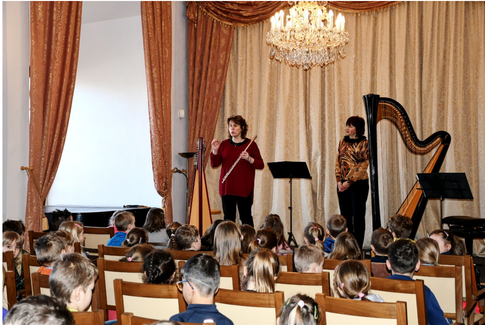
Obr. 13 Výchovný koncert pro děti z mateřských a základních škol ve vlašimském zámku