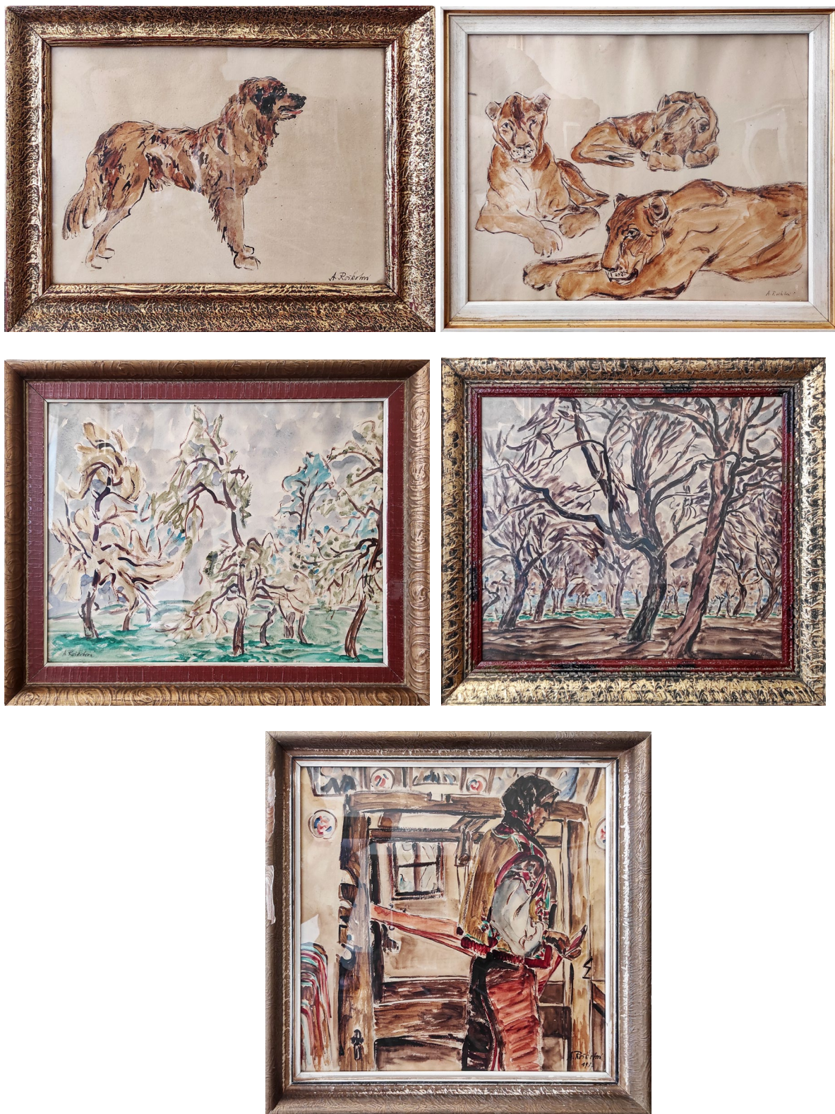
Obr. 2 Pět obrazů vlašimské malířky Anny Roškotové, které byly darovány v roce 2023 do sbírky Muzea Podblanicka, p. o., (foto J. Bouček)