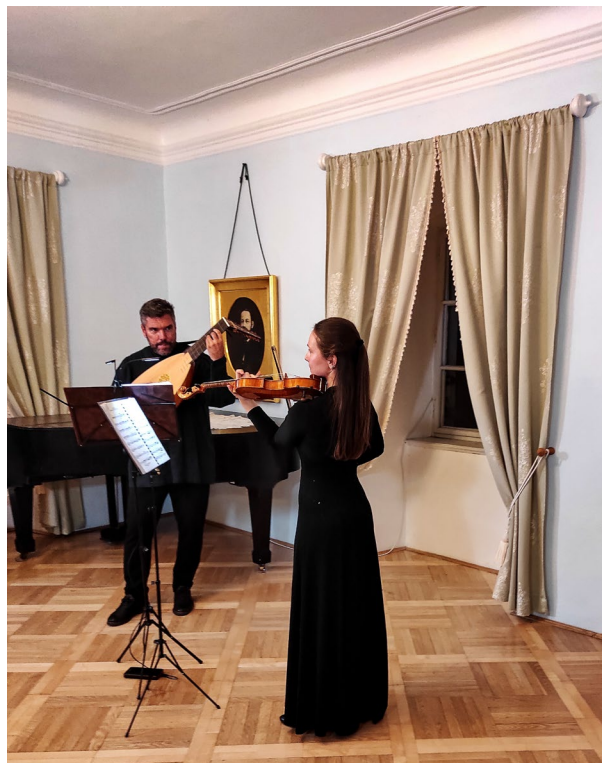
Obr. 14 Koncert Od klasiky do pohádky s loutnou a violou v zámku Růžkovy Lhotice