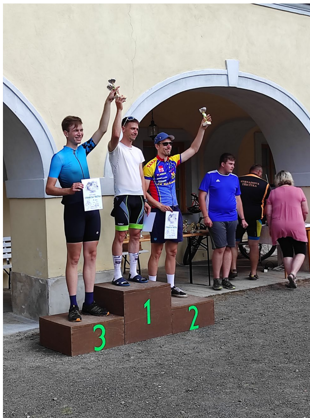
Obr. 18 Vyhlášení vítězů závodu Strnadova třicítka na nádvoří zámku v Růžkových Lhoticích

Muzeum Podblanicka, p. o., je zapojeno do projektu managementu turistického ruchu Kraj Blanických rytířů, do projektu Geopark Kraj Blanických rytířů, na přípravě svých aktivit úzce spolupracuje s místní samosprávou, zejména s městy Benešov, Vlašim a Votice, a s řadou neziskových organizací, jako je Podblanické ekocentrum ČSOP Vlašim, MAS Blaník, Posázaví o.p.s., Podblanické Infocentrum ve Vlašimi a mnoha dalšími.