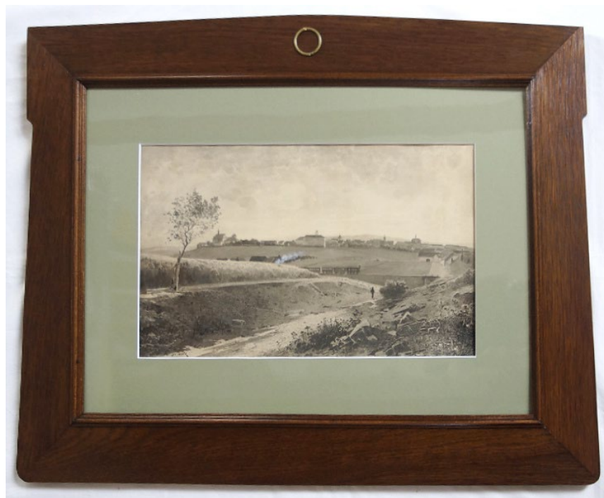
Obr. 5 Zrestaurovaná veduta Benešova od V. Jansy (inv. č. 1251)