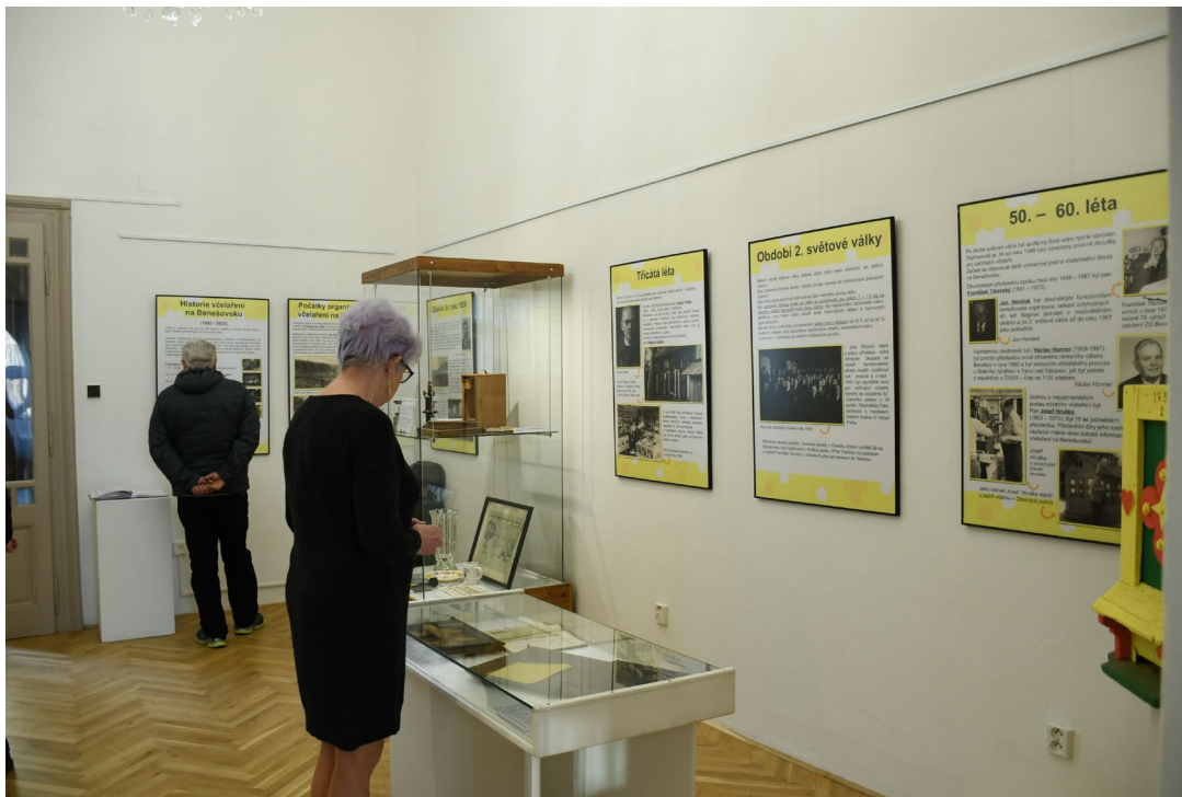
Obr. 9 Instalace výstavy Včely slaví 120 let, historie včelaření na Benešovsku 1903-2023 v domě čp. 74 v Benešově