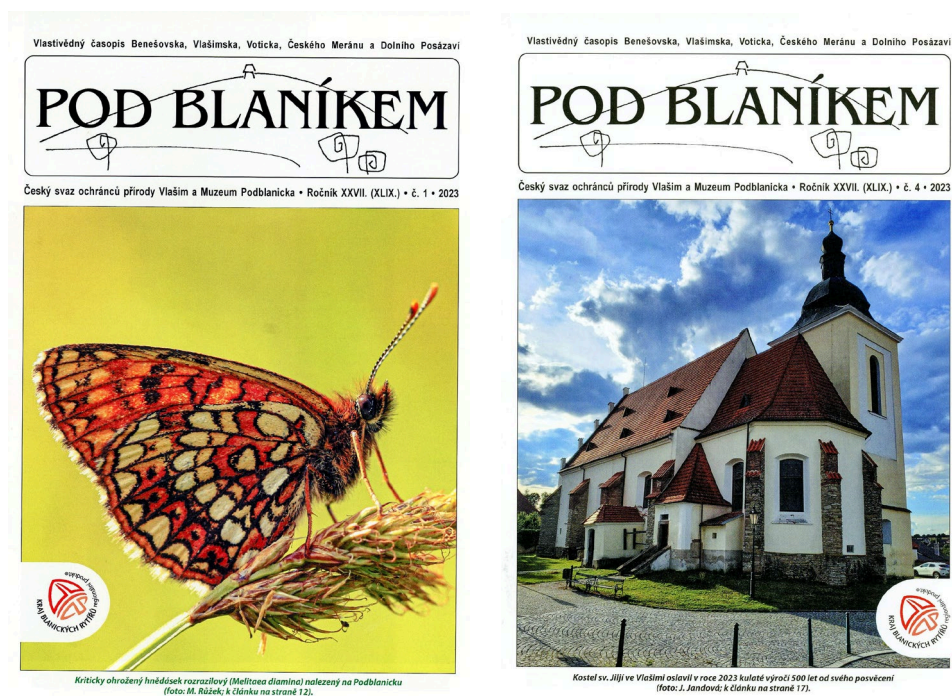
Obr. 19 1. a 4. číslo 27. ročníku časopisu Pod Bláníkem

Webové stránky muzea www.muzeumpodblanicka.cz byly v roce 2023 pravidelně měsíčně aktualizovány a v jejich rámci jsou poskytovány základní informace o nabídce muzea pro veřejnost. Ve sledovaném období je navštívilo celkem 23934 uživatelů. Muzeum používá pro svou propagaci sociální sítě – Facebook (861 sledujících) a Instagram (741 sledujících).