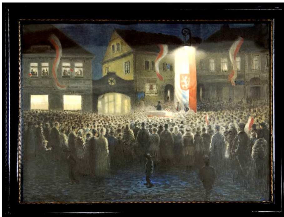
Obr. 6 Zrestaurovaný obraz Vyhlášení republiky v Benešově od F. Holoubka (inv. č. 4900)

Knihovní fond prezenční badatelské knihovny Muzea Podblanicka, p. o., zapsané do evidence knihoven Ministerstva kultury ČR pod evidenčním číslem 6662/2022, byl v roce 2023 rozšířen o 127 nových knihovních položek a čítal k 31. prosinci 2023 celkem 30754 knihovních jednotek. Katalog knihovny je veden v elektronické evidenci za použití speciálního softwaru určeného pro knihovny.