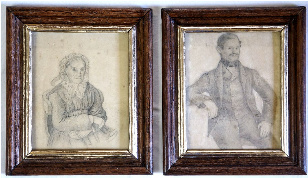
Obr. 4 Zrestaurované portréty manželů Danihelovských z Benešova (inv. č. 1263 a 1264)