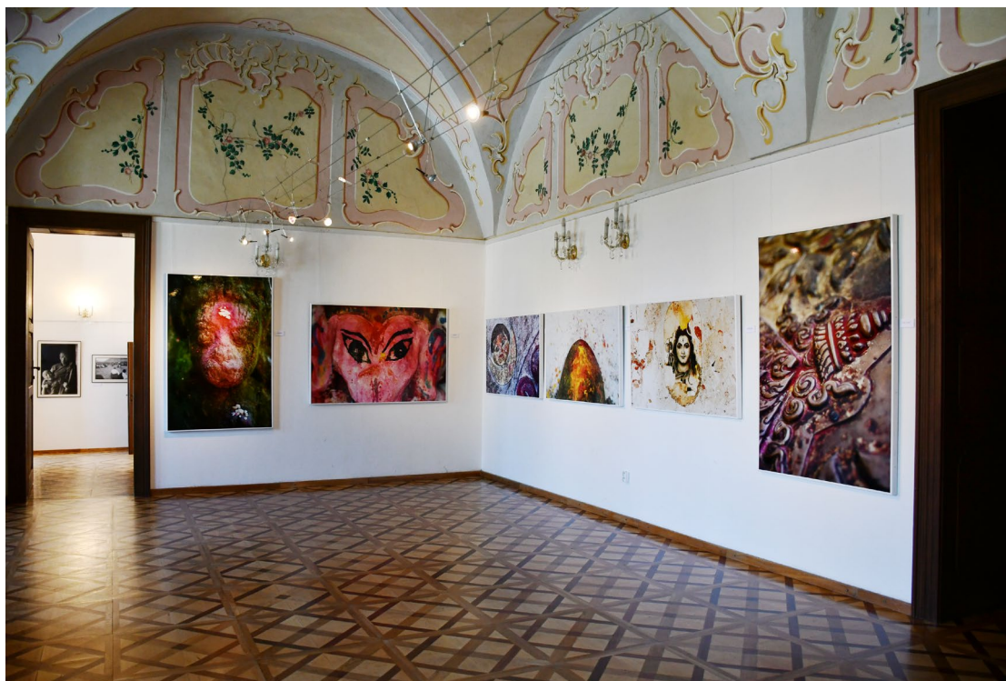
Obr. 8 Instalace výstavy fotografií Zdeňka Lhotáka United Colors of Nepal – Tibet ve vlášimském zámku

pozn. 1) Návštěvnost výstav, které muzeum v roce 2023 spolupřátalo ve spolupráci s jinými institucemi mimo prostory muzea, není muzeem vykazována.