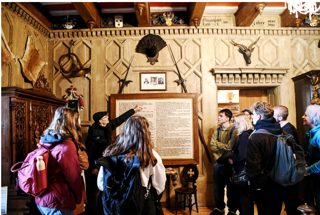
Obr. 17 Komentovaná prohlídka expozic v zámku ve Vlašimi pro maďarské studenty v rámci jejich výměnného pobytu v gymnáziu ve Vlašimi

V roce 2023 Muzea Podblanicka, p. o., spolupřátalo odbornou vědeckou konferenci Mezi obcí a státem. Fenomén okresní samosprávy v českých zemích 1848-2002 , a to u příležitosti 140. výročí úmrtí Karla Drahotína Villaniho, prvního starosty samosprávného okresu Benešov. Spolupřátatelé kromě muzea byli Masarykův ústav a archiv AV ČR, v.v.i., a Státní oblastní archiv v Praze. Konference, která se uskutečnila ve dnech 17.-18. 10. 2023 ve Vlašimi v hotelu Na vývoji, byla součástí výzkumné a vývojové spolupráce Středočeského kraje a Akademie věd ČR na základě Smlouvy o spolupráci mezi Akademií věd ČR a Středočeským krajem. Záštitu nad konferencí převzal radní Středočeského kraje pro oblast kultury, památkové péče a cestovního ruchu Václav Švenda. Byla primárně určena pro odbornou veřejnost, ale zúčastnili se jí také představitelé samosprávy jak na úrovni obcí či krajů. V rámci konference vystoupili přední odborníci na sledovanou problematiku z celé České republiky a ve svých příspěvcích shrnuli aktuální stav současného poznání a také nastínili možnosti dalšího vývoje bádání. Konference se zúčastnilo celkem 68 osob.