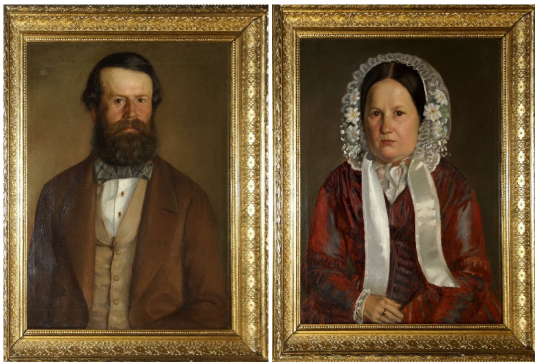
Obr. 3 Zrestaurované portréty benešovského purkmistra Gabriela a jeho manželky (inv. č. 3422 a 3423)

Sbírky muzea byly i v roce 2023 elektronicky katalogizovány a probíhala jejich elektronická dokumentace ve sbírkovém evidenčním programu muzea. K 31. prosinci 2023 bylo prostřednictvím základní digitální fotodokumentace zpracováno celkem 42673 sbírkových předmětů, tj. 74 % sbírkového fondu. V roce 2023 bylo zrevidováno celkem 5066 inventárních položek sbírkového fondu. Tím byl dokončen druhý decenální inventarizační cyklus revize muzejní sbírky v souladu s platnou legislativou.