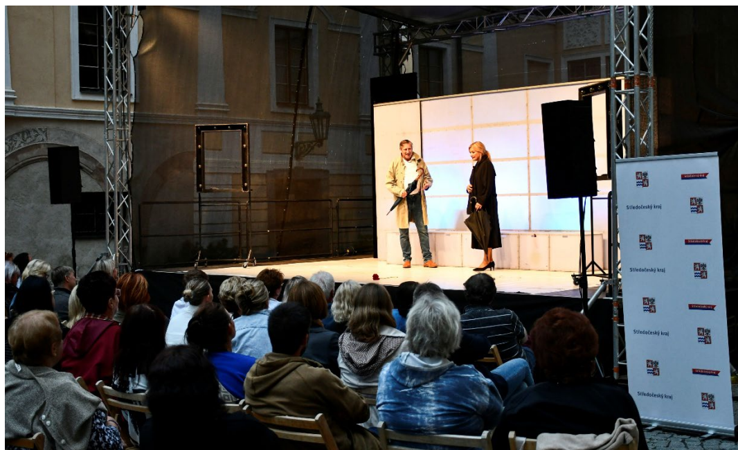
Obr. 11 Divadelní představení Nikdy není pozdě Divadla Kalich na nádvoří zámku ve Vlašimi se uskutečnilo v rámci festivalu Středočeské kulturní léto