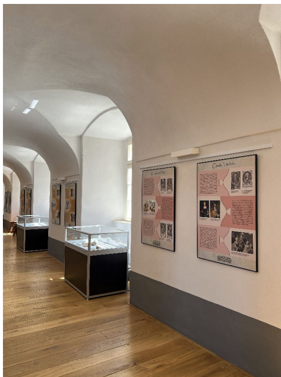
Obr. 8 Instalace výstavy Za vlády Marie Terezie v klášteře sv. Františka ve Voticích