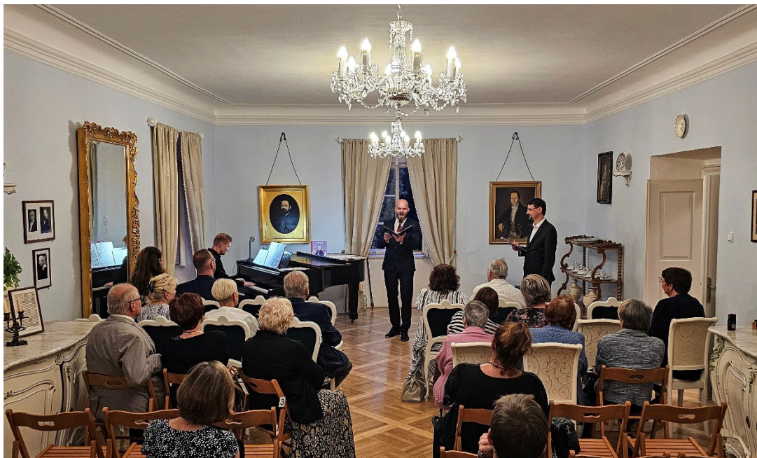
Obr. 10 Koncert Hudba revolučního roku 1848 v podání uskupení Ostravská bandaska v zámku Růžkovy Lhotice