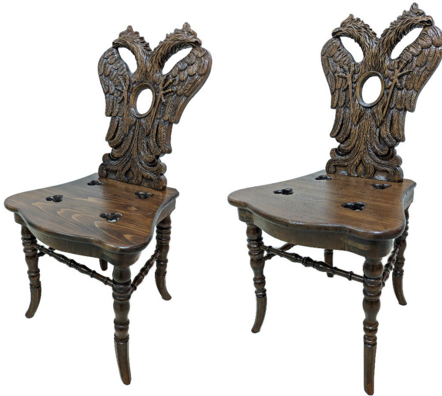
Obr. 3 Dvě z dřevěných vyřezávaných židlí v historizujícím slohu ze sbírek muzea restaurovaných v roce 2025