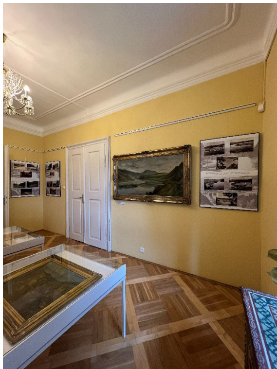
Obr. 7 Instalace výstavy Vltava a její proměny v zámku Růžkovy Lhotice