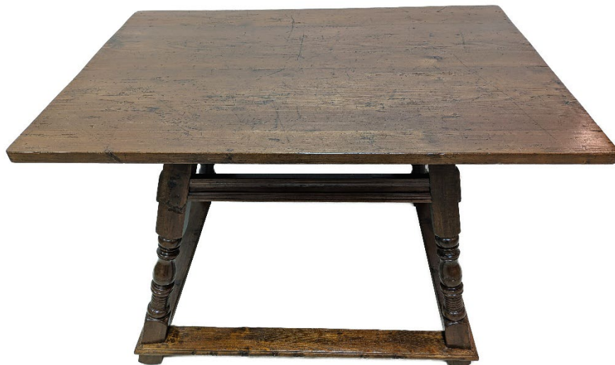
Obr. 2 Zrestaurovaný dřevěný historizující stůl z 19. stol. ze sbírek muzea (foto R. Bobek)

u kterých to vyžadoval jejich stav. Odborně restaurovány pak byly barokní skříňové hodiny (konec 18. stol. 1800, inv. č. 3978) a 5 kusů nábytku, konkrétně čtyři dřevěné historizující židle s vyřezávaným opěradlem (19. stol., inv. č. 2998-3001) a dřevěný historizující stůl (19. stol., inv. č. 2994).