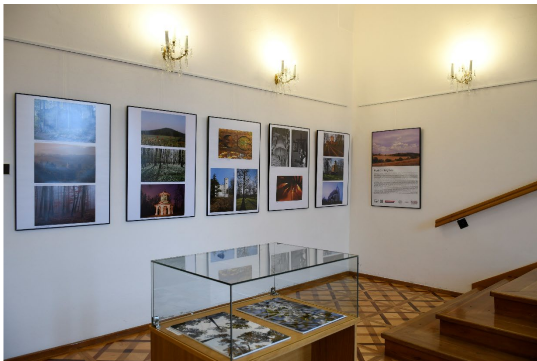
Obr. 4 Instalace fotografické výstavy Hudební krajinou ve vlášimském zámku

pozn. 1) Návštěvnost výstav, které muzeum v roce 2025 spolupřádalo ve spolupráci s jinými institucemi mimo prostory muzea, není muzeem vykazována.