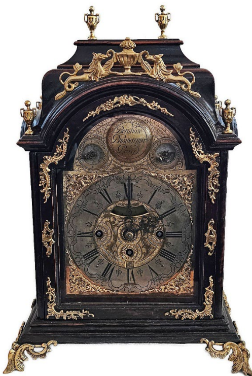
Obr. 1 Restaurované barokní skříňové hodiny z konce 18. stol. označené Bernard Biswanger in Prag ze sbírek muzea

Rozšíření sbírkového fondu muzea proběhlo v roce 2025 prostřednictvím zápisu nálezů získaných v rámci záchranné archeologické činnosti muzea.