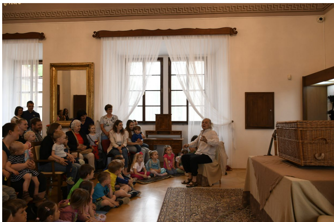
Obr. 15 Součástí programu v rámci Dne Středočeského kraje připraveného pro návštěvníky muzea v zámku ve Vlašimi bylo i dětské divadelní představení O Pejskovi a kočičce

pozn. 1) Návštěvnost kulturně výchovných akcí, které muzeum v roce 2025 spolupřádalo ve spolupráci s jinými institucemi mimo prostory muzea, není muzeem vykazována.