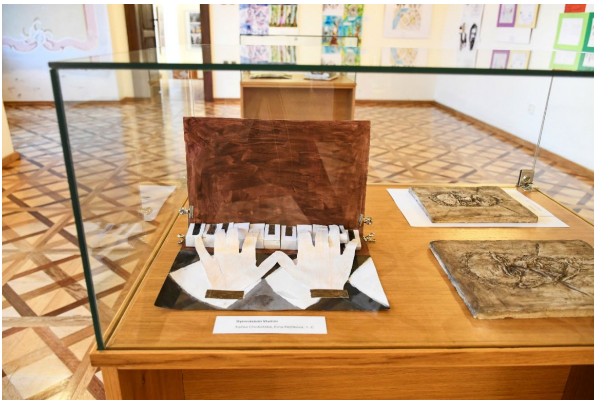
Obr. 12 Instalace prací z výtvarné soutěže Malujeme s muzeem ve vlašimském zámku

Pravidelně jsou mezi kulturně výchovnými akcemi muzea zastoupeny i přednášky. V roce 2025 jich muzeum uspořádalo v zámku ve Vlašimi celkem 8 a byly zaměřeny na historii a archeologii, přičemž mezi tématy bylo akcentováno také výročí 200 let od založení firmy Sellier a Bellot. (viz Příloha č. 2).