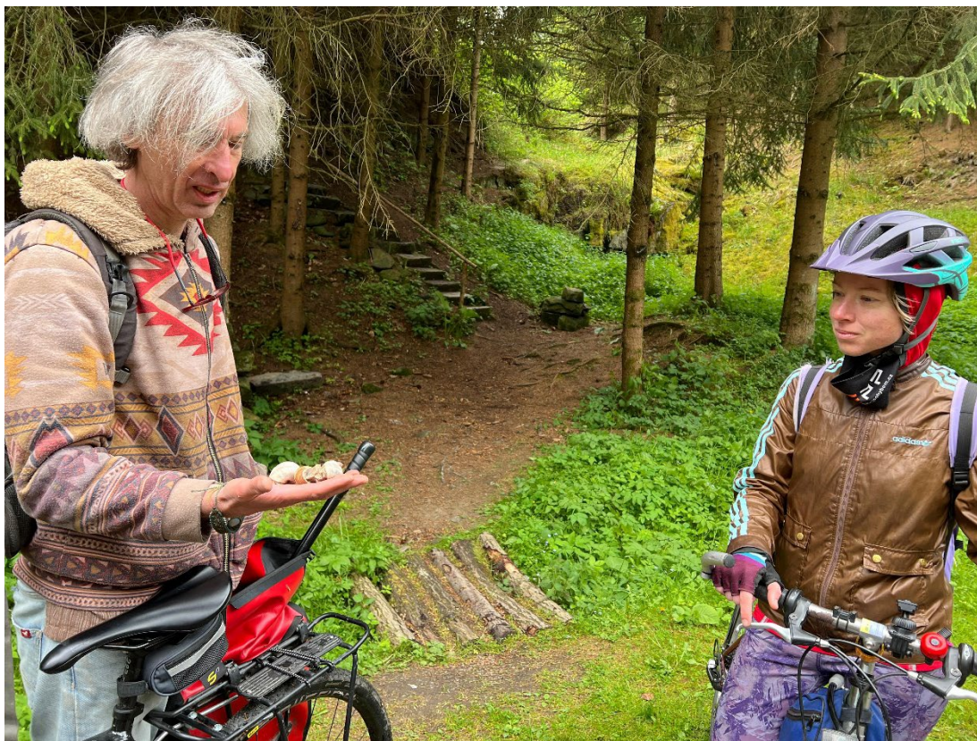
Obr. 16 Momentka z muzejního cyklovýletu na Zbořený Kostelec

Z dalších akcí, na jejichž pořádání se v roce 2025 muzeum podílelo, připomeňme 38. ročník cyklistického závodu Strnadova třicítka v Ružkových Lhoticích, který se uskutečnil 28. června 2025 a jehož start i cíl byly tradičně v areálu muzea, muzejní cyklovýlet na Zbořený Kostelec či křest knihy Čtení o lidovém léčitelství lidí a zvířat.