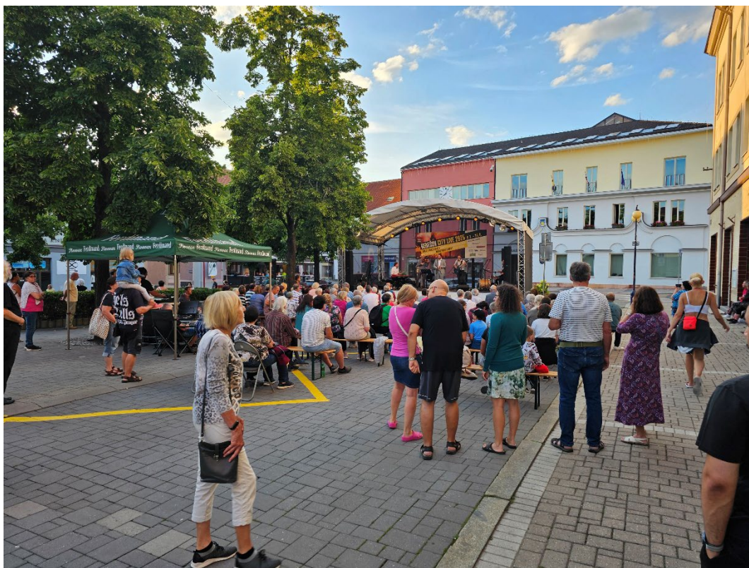
Obr. 11 Koncert Tingl tangl na náměstí v Benešově v rámci festivalu Středočeské kulturní léto

Tradičně si Muzeum Podblanicka, p. o., připomnělo také Mezinárodní den muzeí, Dny evropského kulturního dědictví a Den Středočeského kraje. V rámci těchto akcí připravilo pro návštěvníky jak v zámku ve Vlašimi, tak v zámku v Růžkových Lhoticích bohatý doprovodný program.