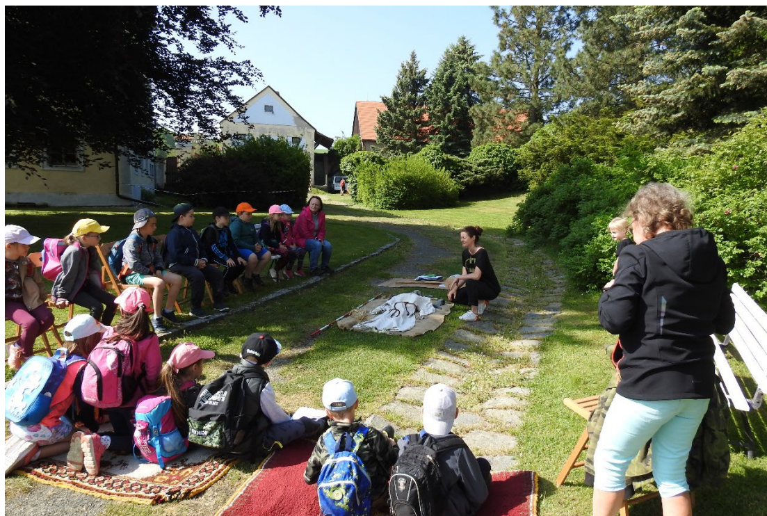
Obr. 14 Edukační program věnovaný archeologii v zámku Růžkovy Lhotice